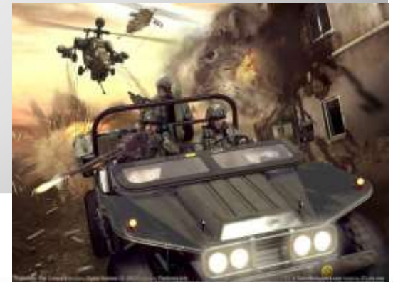
Рис. 1 Пример одной из стратегических игр