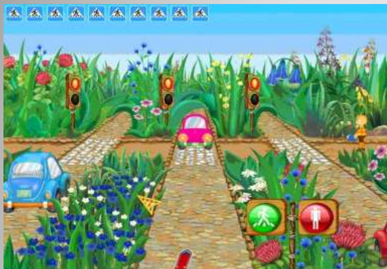
Рис.3 Пример игры-симулятора «Правила дорожного движения»