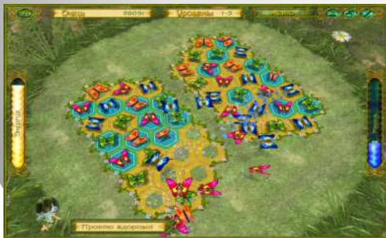
Рис.2 Пример логической игры «Сказочная история»

4) Ролевые Цель героев – исследовать виртуальный мир и выполнить поставленную в начале игры задачу. Задачей может быть отыскание определённого клада.